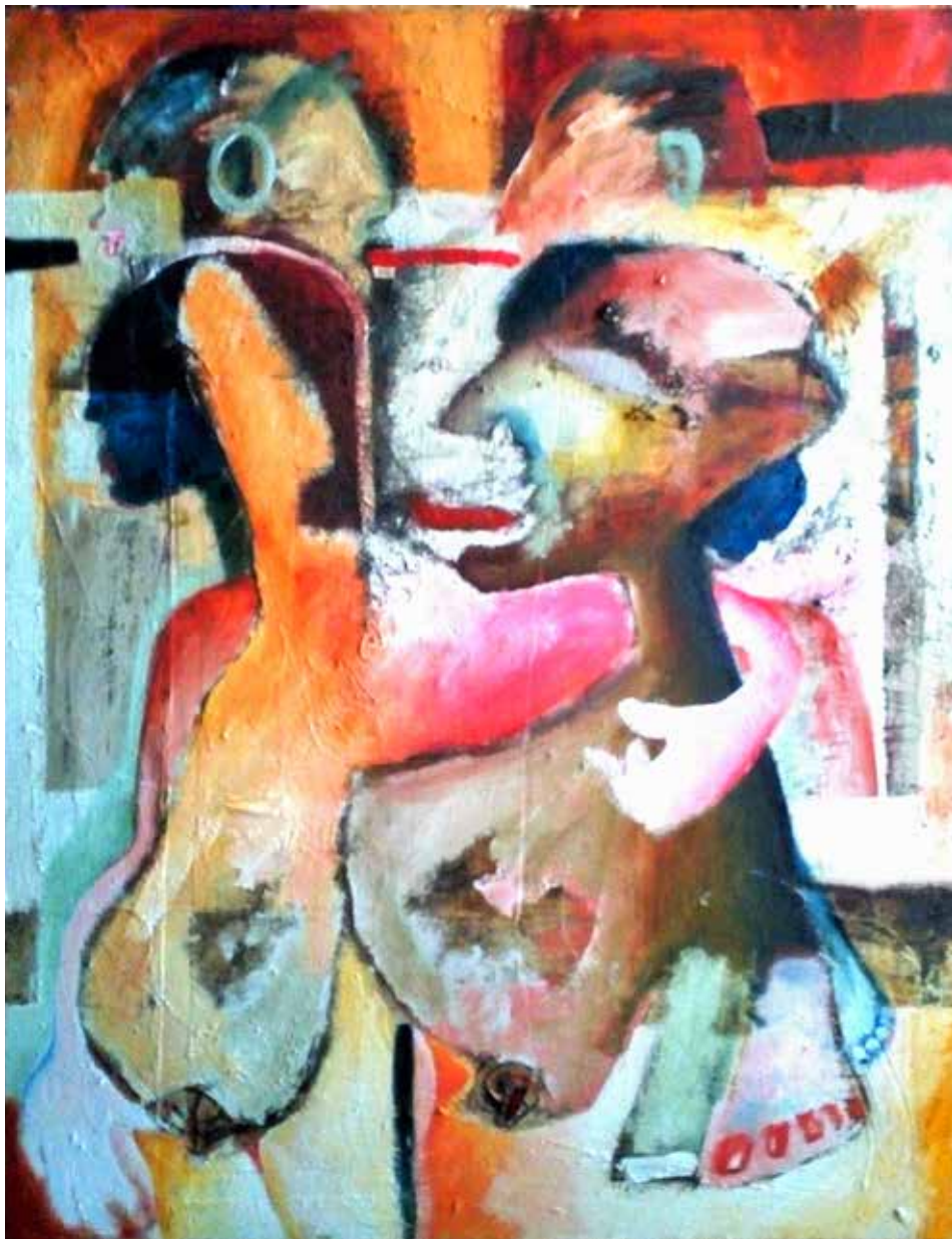
Parella i altres cares (Tècnica mixta s / tela 100 x 80)