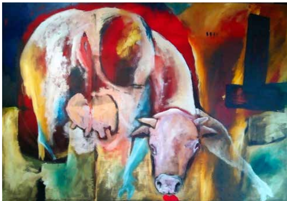
“For export”, (Acrylic s / İlenç, 120 x 160)