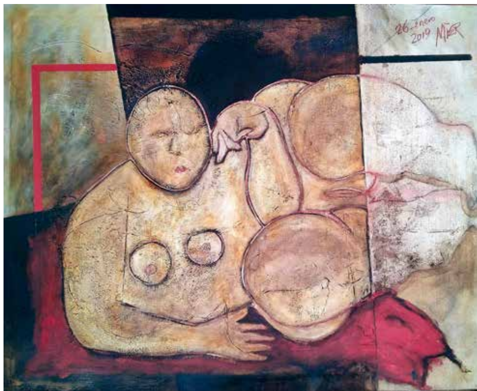
Repòs (Tècnica mixta s / tela, 80 x 100)