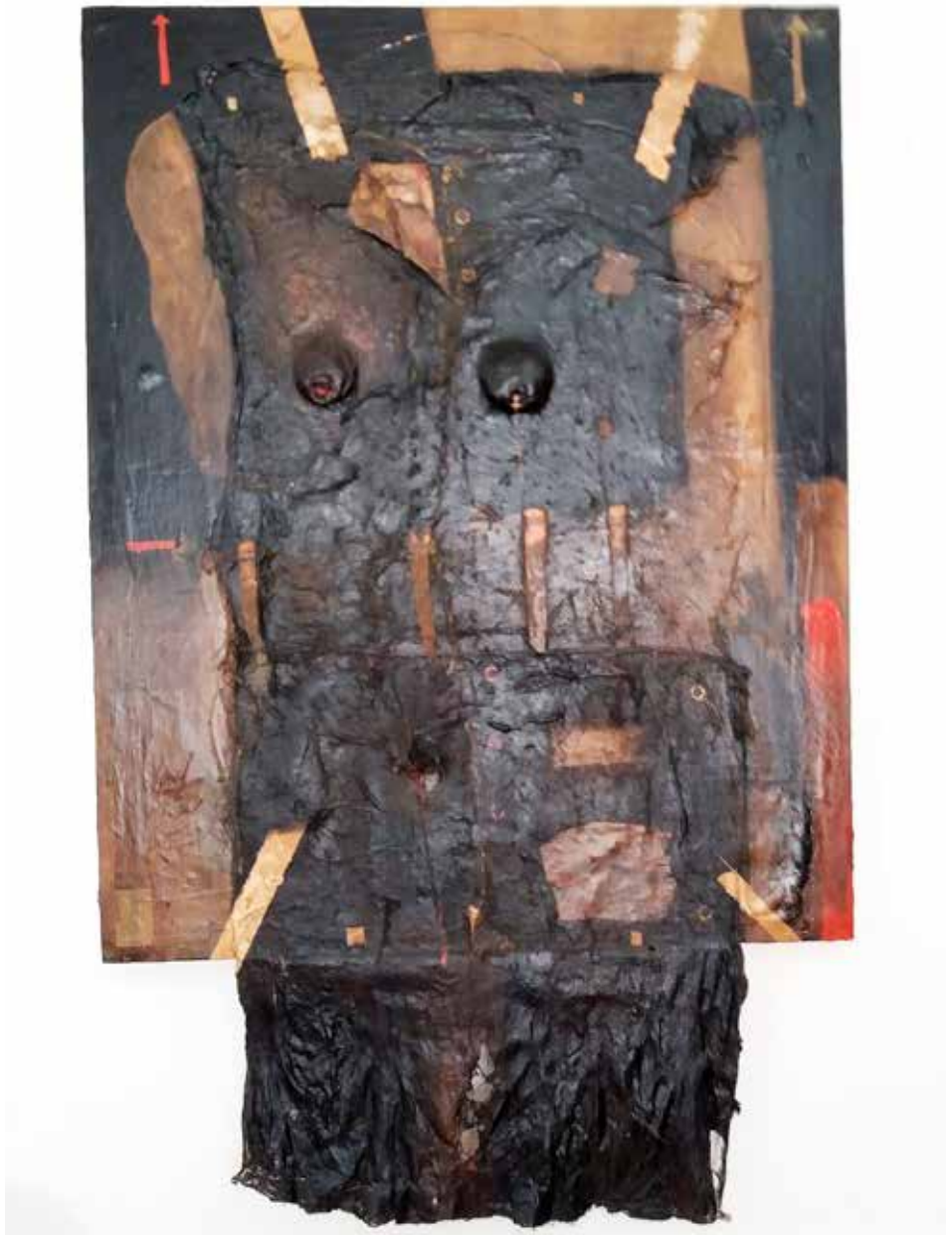
Vestit (Tècnica mixta 130 x 80)