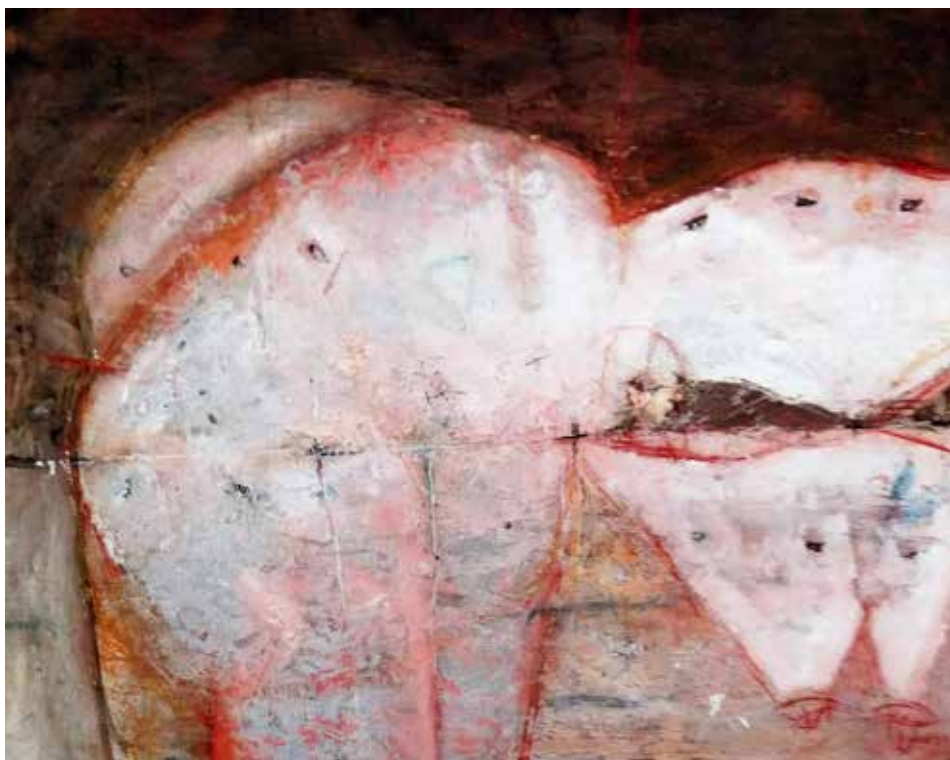
S / Títol (Tècnica mixta s/lleç 100 x 80)