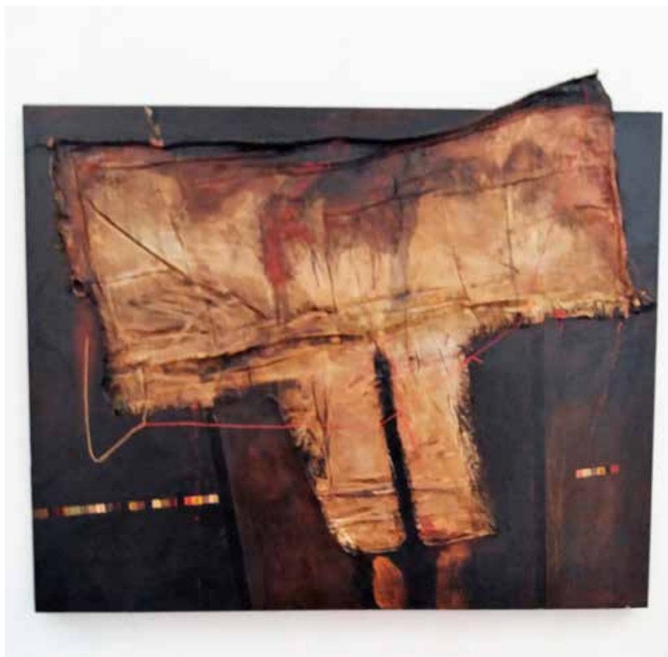
Ícar (Tècnica mixta s / tela 100 x 80)