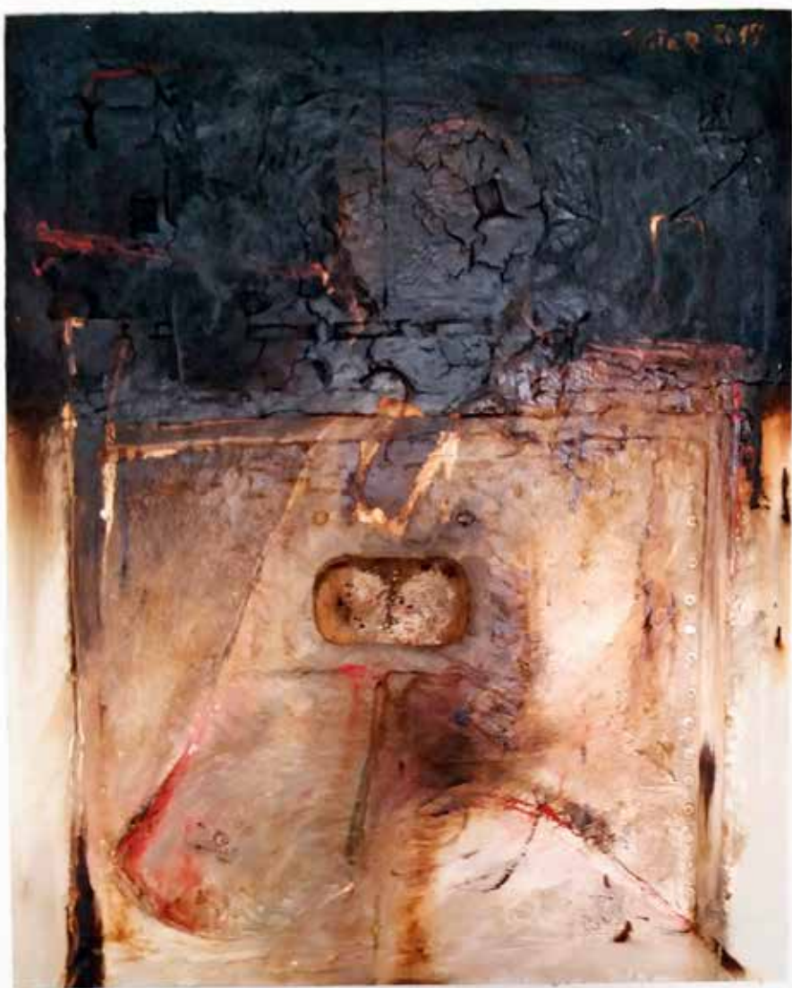
Artigas (Tècnica mixta 100 x 80)