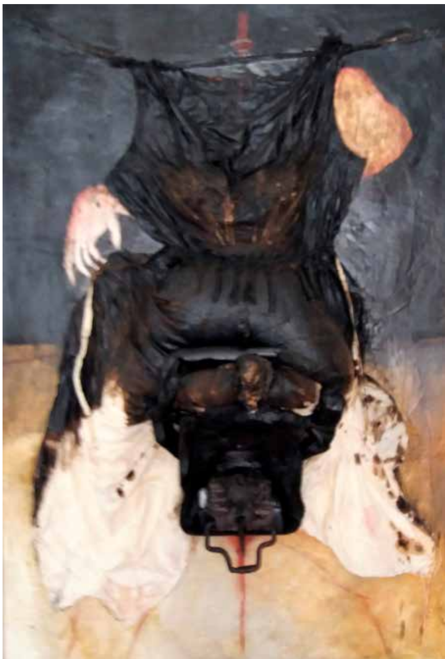
Camperola (Tècnica mixta s / tela 120 x 90)