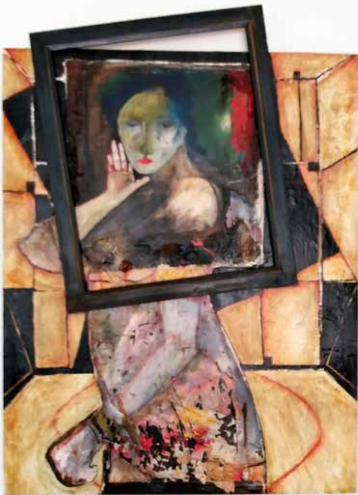
Retrat (Tècnica mixta s/llenç 115 x 80)