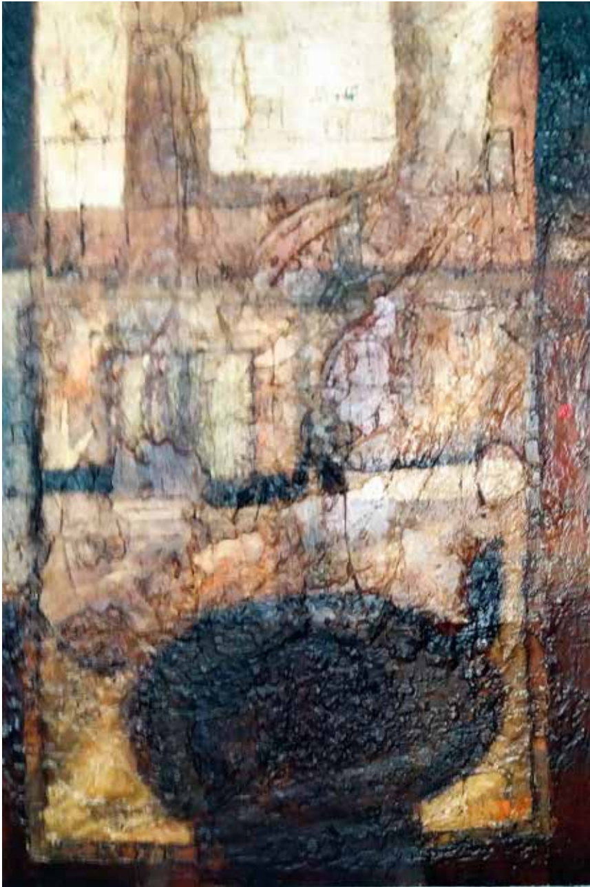
Demolició (Tècnica mixta s/lleñç 160 x120)