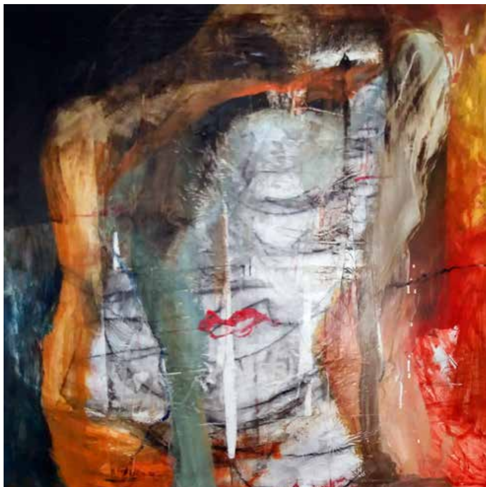
Pierina (Tècnica mixta 120 x120)