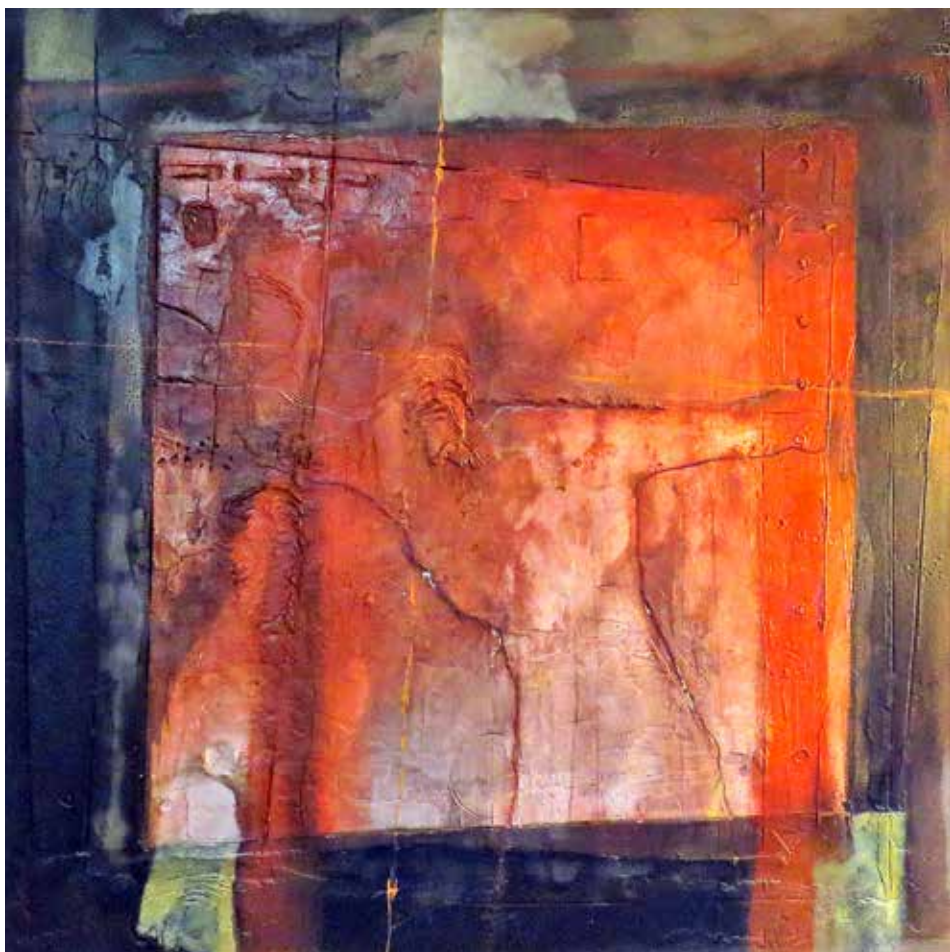
Viacrucis (Tècnica mixta 120 x 120)