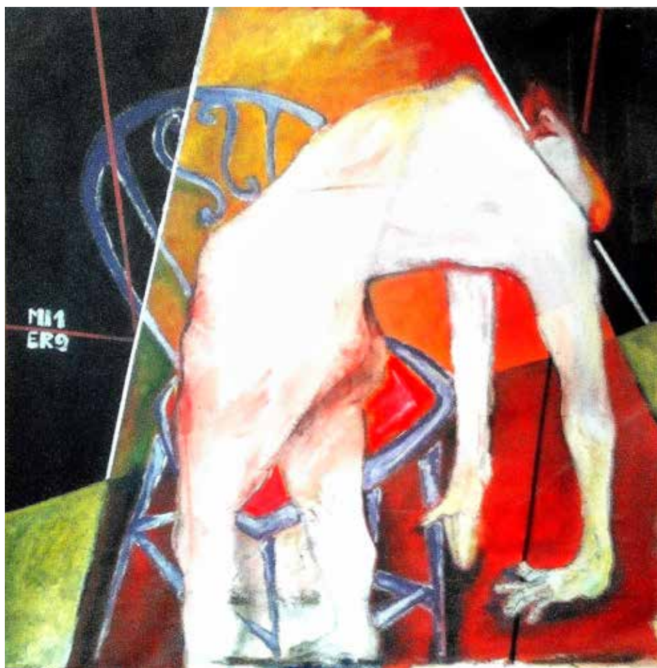
Ballarina (Acrílic s / llenç 120 x 120)