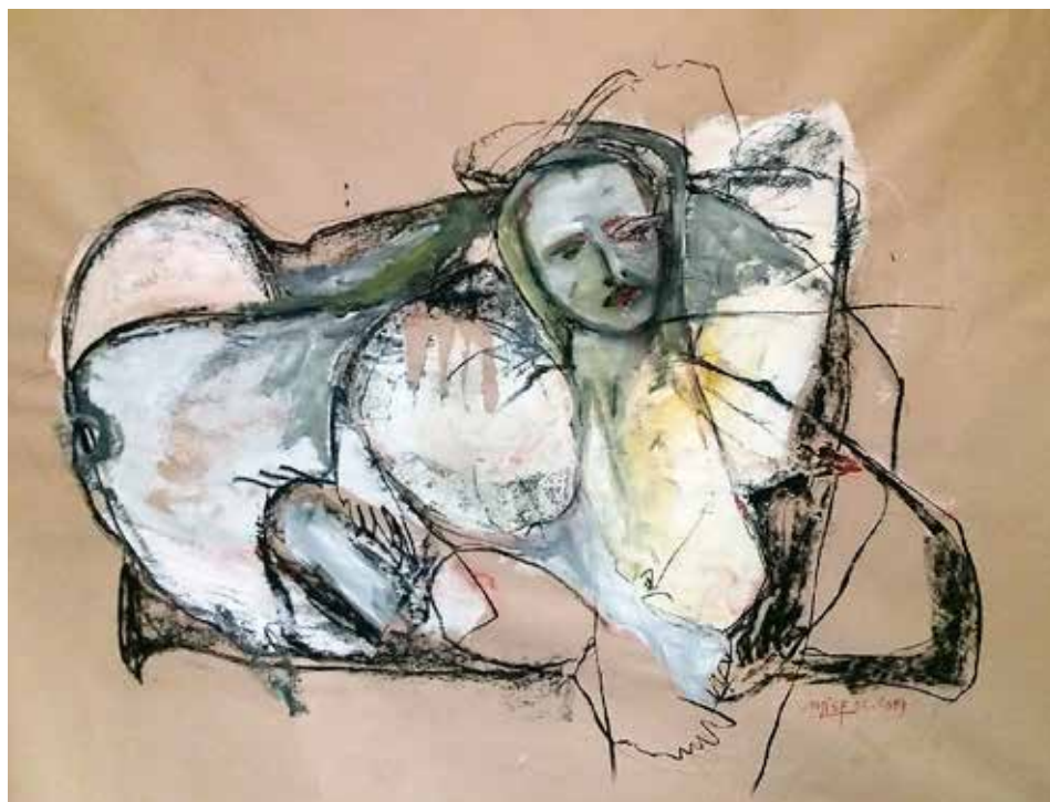
Sub-belén (crayón i acrílic s / kraft 150 x 120)