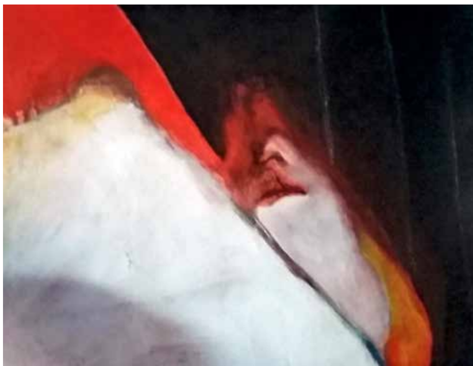
Ballarina detall (Acrylic s / tela, 120 x120)