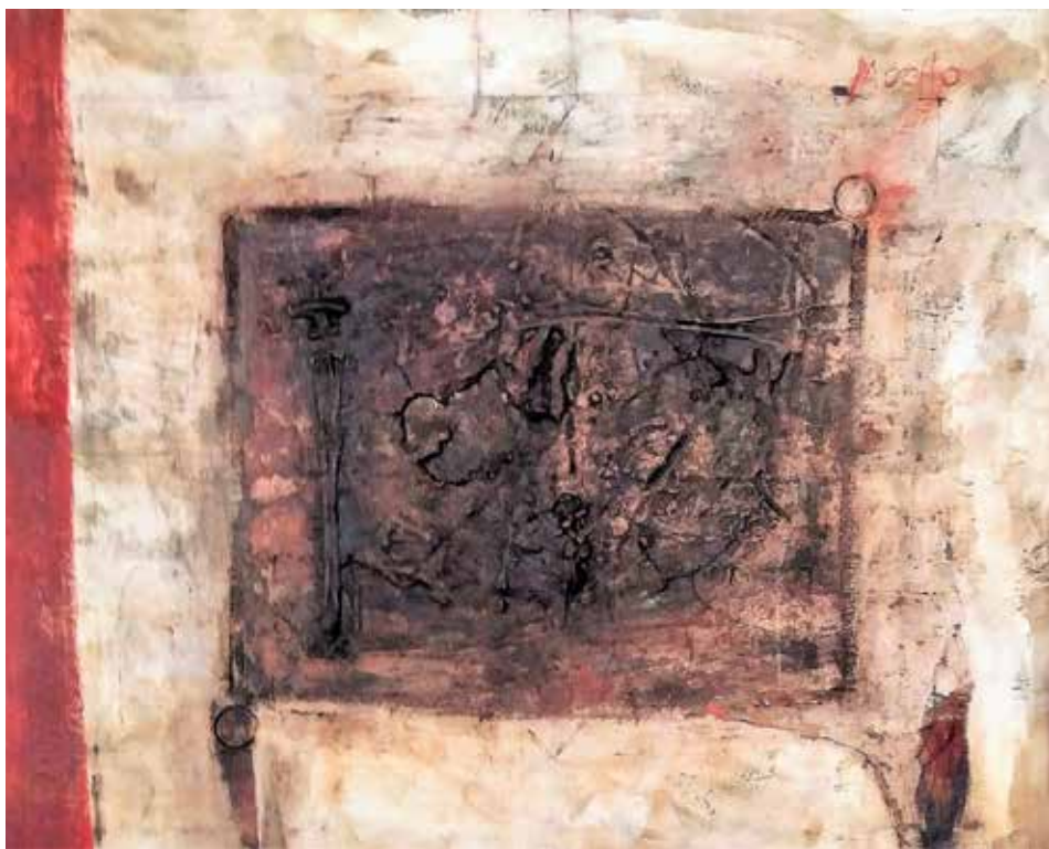
Salamandra (Tècnica mixta 100 x 80)