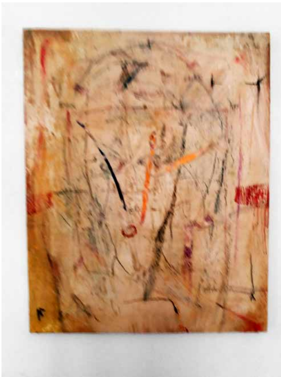
Dona (Tècnica mixta 100 x 80)