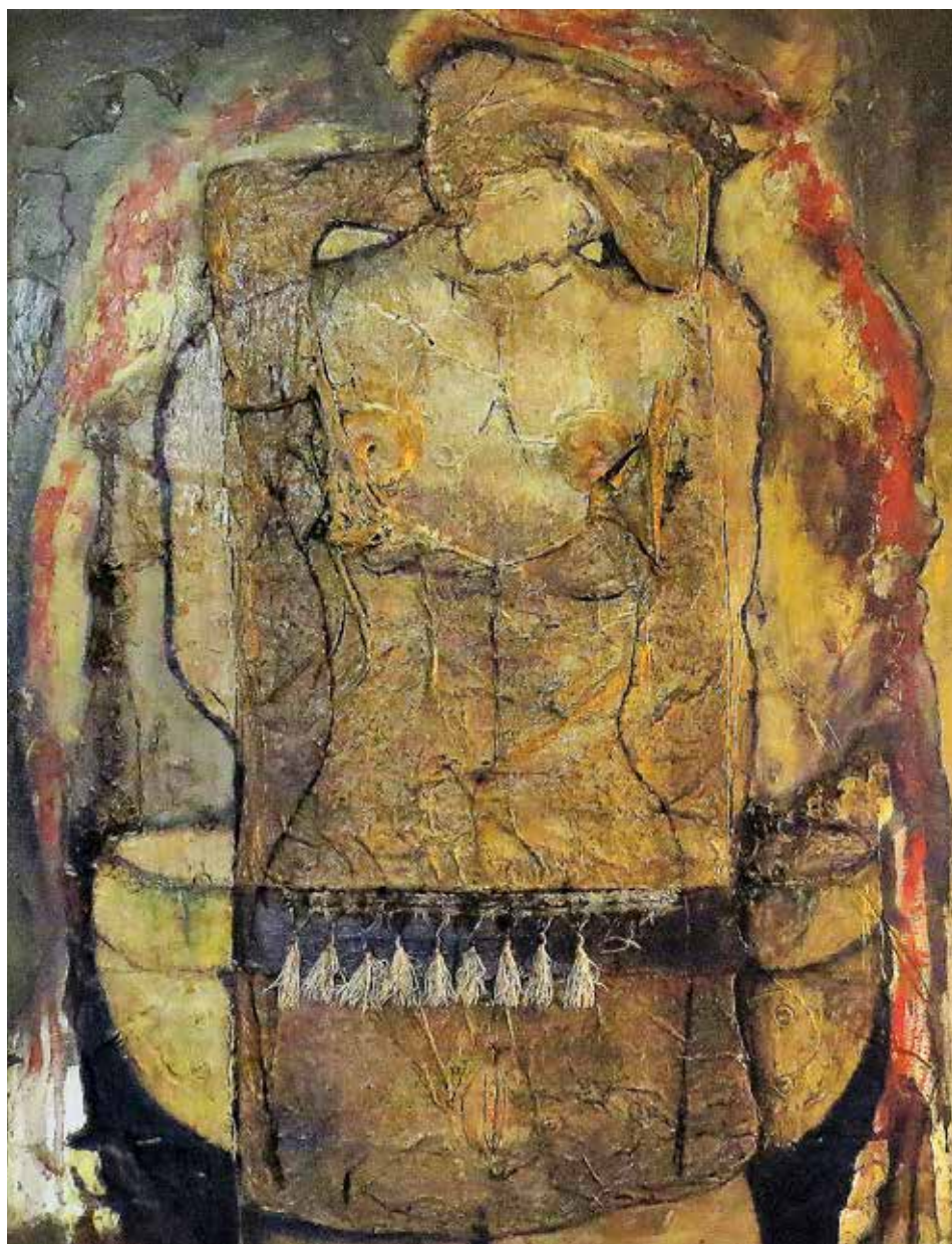
Noia a la font (Tècnica mixta s / tela 100 x 80)