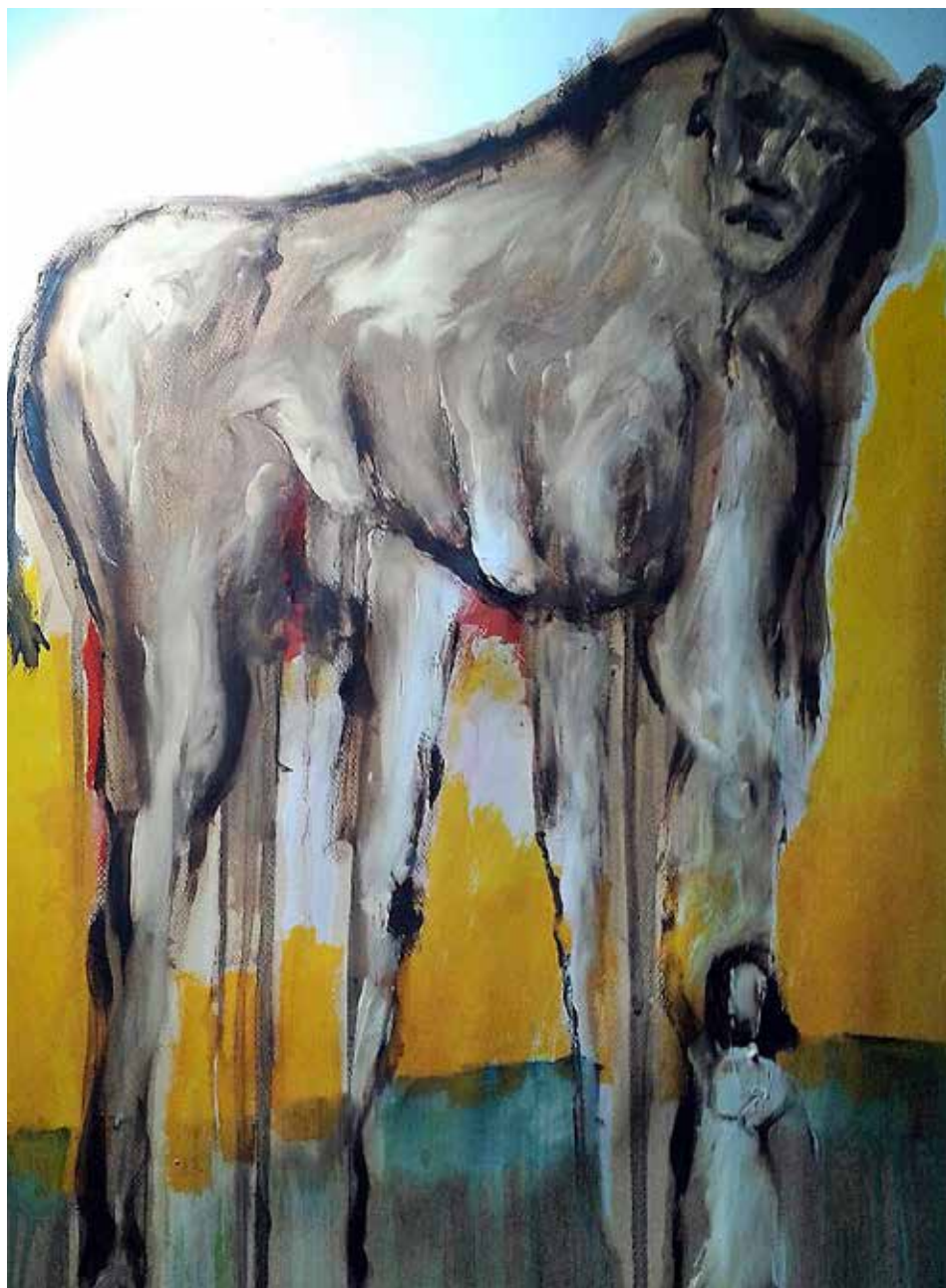
Llop (Acrilic s / paper 50 x 70)